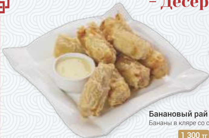
Банановый рай | 炸香蕉 Бананы в кляре со сгущенкой