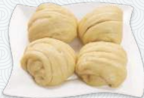
Пампушки на пару | 花卷