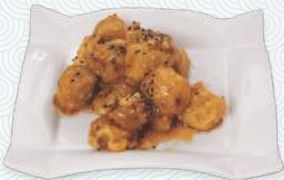
Toffee banana | 拔丝香蕉 Банан в карамели