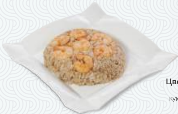
Креветки с рисом