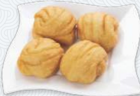
Пампушки жареные | 花卷(炸)