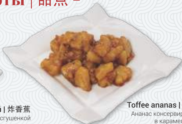
Toffee ananas | 拔丝菠萝 Ананас консервированный в карамели