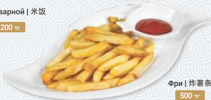
Фри | 炸薯条