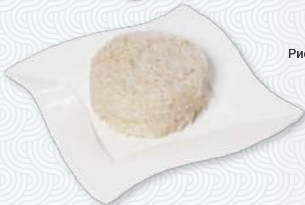
Рис отварной | 米饭