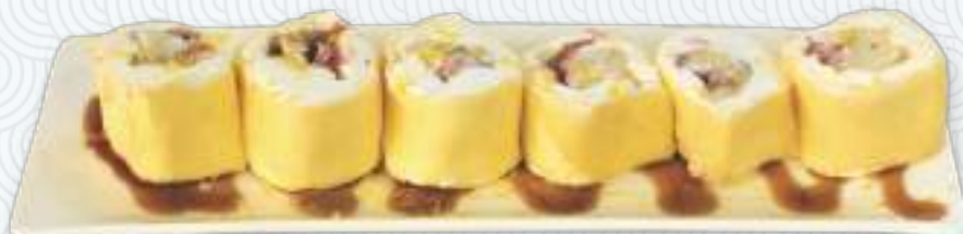
Райское наслаждение (6 шт) японский блинчик, сыр филадельфия, банан, клубника, ананас