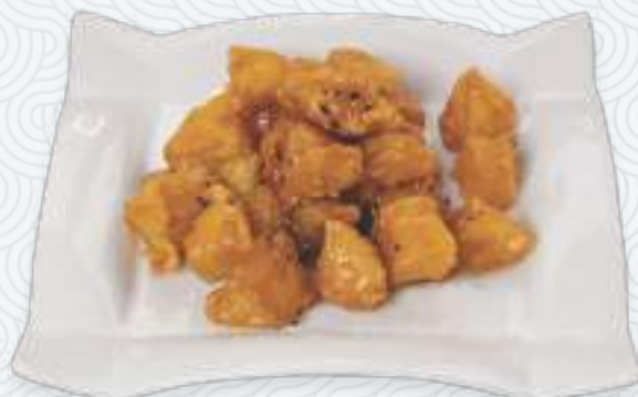
Toffee apple | 拔丝苹果 Яблоки в карамели